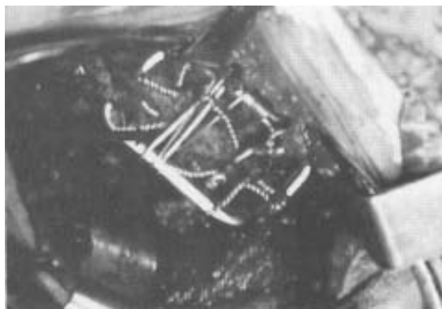
Figura 2. Resultado final en cirugía, se marca alambre sobre el marco que está anclado en las apófisis transversas y que sirve de tracción para reducir la listesis.